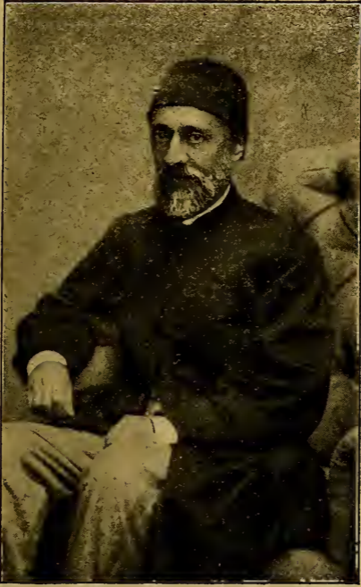
صدر اسبق عالی پاشا