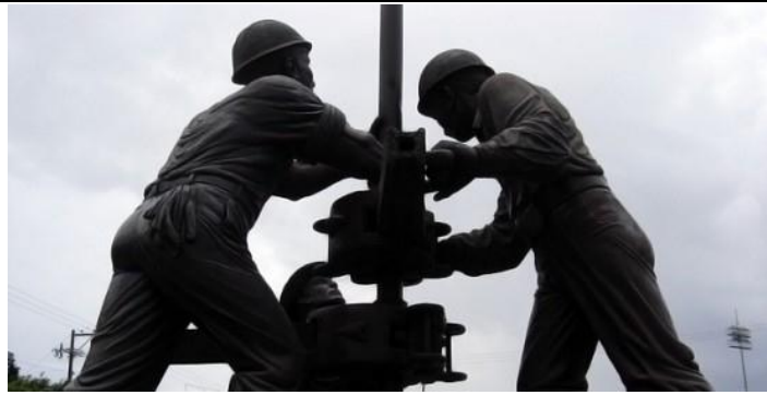
Monumento a los Obreros Petroleros en Poza Rica Ver.

Hay una ciudad petrolera, considerada hace muchos años segunda capital de México debido a la gran producción en barriles de oro negro obtenidos de sus entrañas. Poza Rica Veracruz se fundó en los brazos de los obreros que llegaron a radicar a este suelo y en los corazones diligentes de las mujeres que siguiendo a sus esposos formaron esta ciudad que se veía a lo lejos por la gran cantidad de “quemadores” que cuál pebeteros antiguos daban señal de que aquí ardía un pueblo que amaba el trabajo y que defendía el derecho a la libertad.